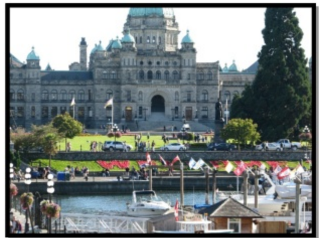
Escapade dans l'Ouest canadien

En plus d'offrir un beau choix de voyages, tout a été mis en place pour bien communiquer l'information et faciliter les inscriptions. Celles-ci se font en ligne à l'aide d'un formulaire qui se trouve sur le site WEB. En plus des voyages terrestres, nous proposons des croisières et certains voyages thématiques.