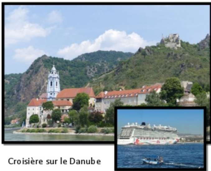
Croisière sur le Danube